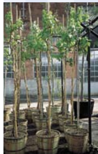
FRUTTIFERI DI PRONTA FRUTTIFICAZIONE