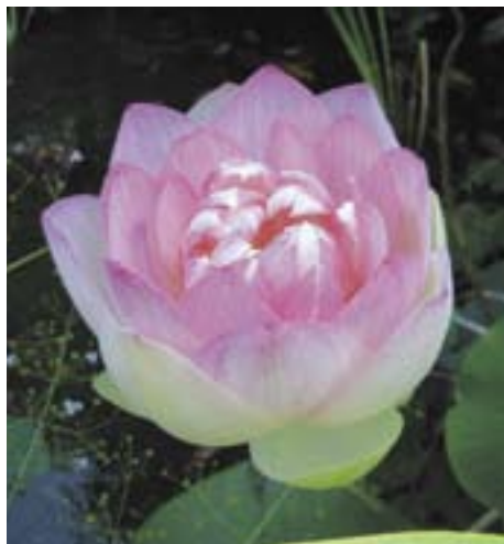
NELUMBIUM NUCIFERA 'PULCHRUM'