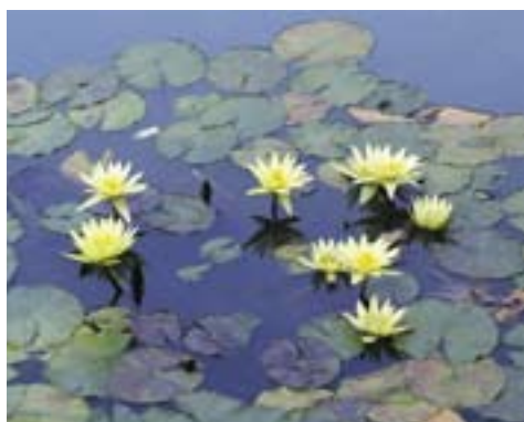
NINFEA TROPICALE ST. LOUIS GOLD