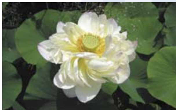
NELUMBIUM NUCIFERA 'ALBA GRANDIFLORA'