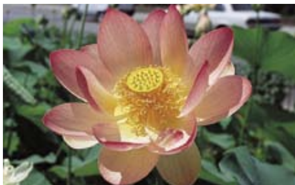
NELUMBIUM NUCIFERA 'MOMO BOTON'